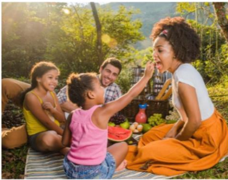
FAZER UM PIQUENIQUE COM A FAMÍLIA