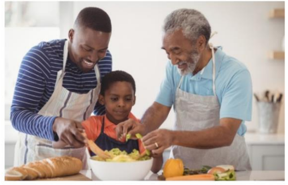
FAZER UMA CULINÁRIA COM A FAMÍLIA