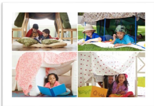
CABANA COM LENÇOL