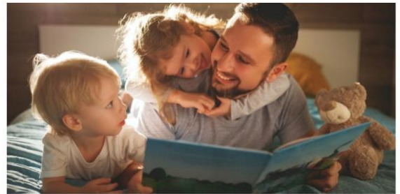
OUVIR OU CONTAR UMA HISTÓRIA ANTES DE DORMIR