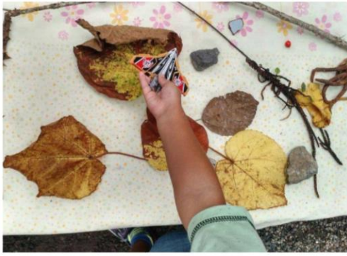
PROCURAR POR PLANTAS OU BICHINHOS NA NATUREZA